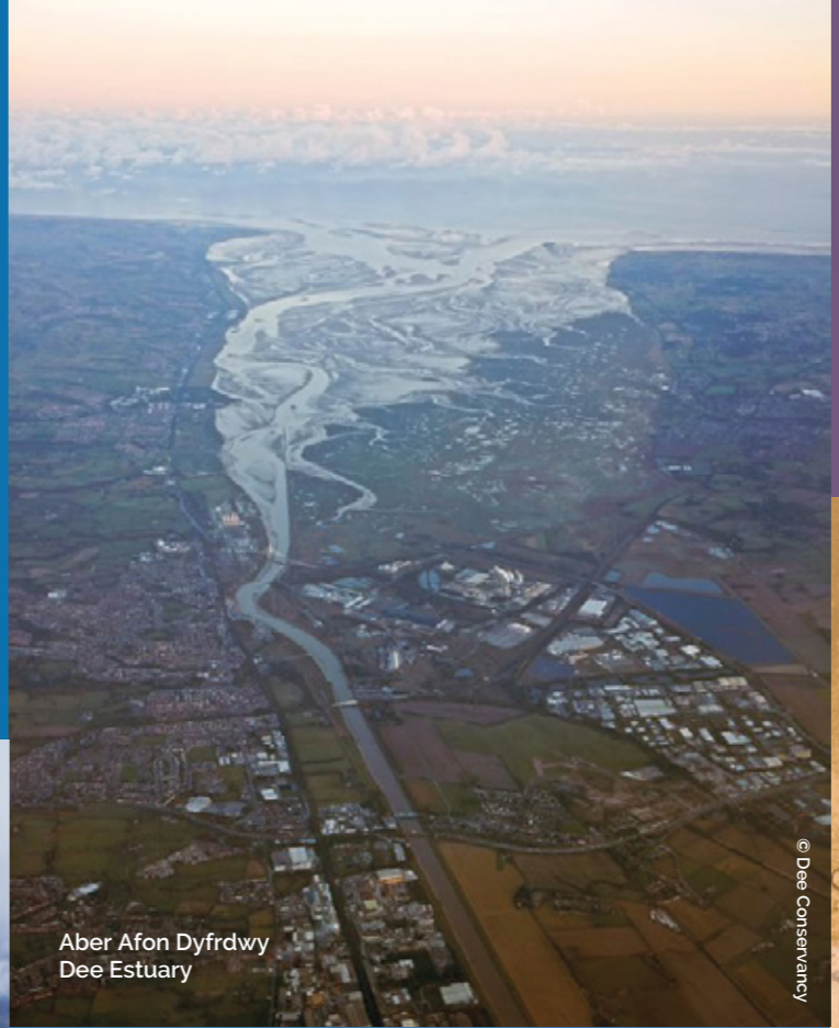
Aber Afon Dyfrdwy Dee Estuary