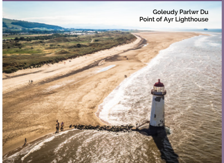
Goleudy Parlwr Du Point of Ayr Lighthouse

★ Castell Conwy a Castell Fflint Adeiladwyd y cestyll hyn gan Edward I, brenin Lloegr. Mae Castell Conwy a'i dref gaerog yn un o Safleoedd Treftadaeth y Byd; Castell Fflint oedd un o gestyll cyntaf Edward I wrth iddo ormesu'r Cymry yng ngogledd Cymru.